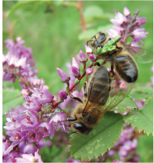
Bier i lyng