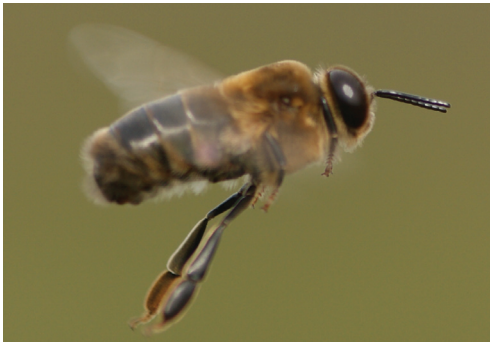
Flyvende drone (han-bi)

I bifamilien er det udelukkende dronningen, der lægger æg; og det er derfor kun hende, der skal parres. Selv om dronningen kan blive flere år gammel, parrer den sig kun i én ganske kort periode, når den er ca. en uge gammel. I gennemsnit får den unge dronning sæd fra 15 droner, som opbevares i et sædgemme og bruges, efterhånden som æggene lægges. Parringerne foregår aldrig i bistadet, men altid i fri luft og ofte højt til vejrs langt fra stadet. Her møder den brunstige