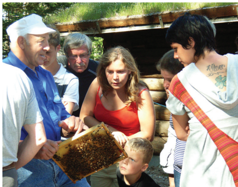
Foredrag ved Skovhytten