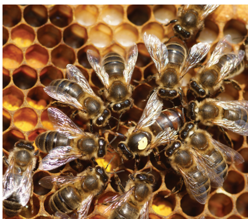
Arbejdere omkring en æglæggende dronning

Desværre er der sket en forringelse af øens lyngarealer i de senere år, - især på grund af tilgroning. Det betyder, at honningudbyttet i nogle år kan være meget sparsomme, og at efterspørgslen derfor ikke kan efterkommes. Honningen fra de brune bier markedsføres med en speciel lågetiket, der er din garanti for, at honningen er indsamlet af brune bier i Læsøs natur, og at der ikke bruges pesticider i arbejdet med bierne.